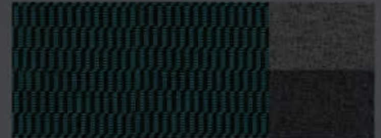
Modrý C&T Cran Bleu s medailónikmi Prešívanie Brasilia na úrovni Active