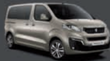
Sivá Silky Grey