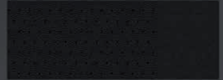
Perforovaná / Neperforovaná čierna koža Claudia Béžové prešívanie Beige Impala na úrovni Allure