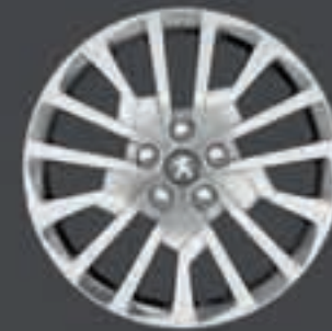
Puklica Miami 17"