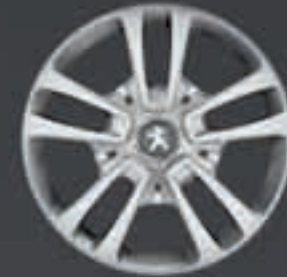
Puklica San Francisco 16"