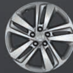
Disk Phoenix 17"