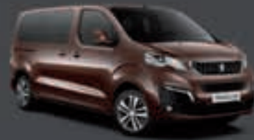
Hnedá Rich Oak