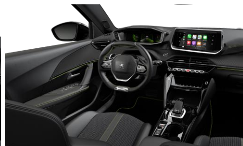
GT / e-GT Poťah sedadiel CAPY