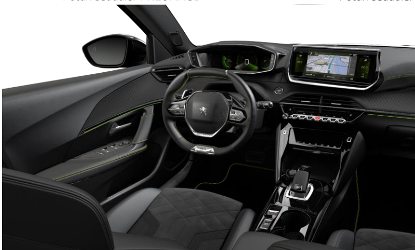
GT PACK / e-GT PACK Poťah sedadiel ALCANTARA tmavý