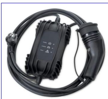
Štandardný kábel pre zapojenie do domácej 230V zásuvky 98 444 688 80