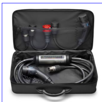
Súprava s nabíjacou jednotkou pre zapojenie do viacerých druhov elektrickej siete (230V/400V/WallBox) 98 357 837 80