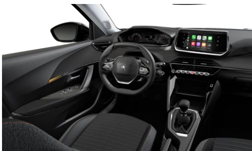
ACTIVE / e-ACTIVE Poťah sedadiel PNEUMA 3D