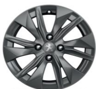
16" zliatinové disky ELBORN