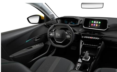
ALLURE / e-ALLURE Poťah sedadiel COZY