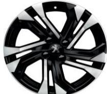
17" zliatinové disky SALAMANCA