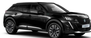
Čierna PERLA NERA