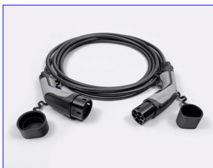
Kábel režimu 3 pre pripojenie do nabíjacej stanice (domáceho WallBoxu alebo verejnej stanice)