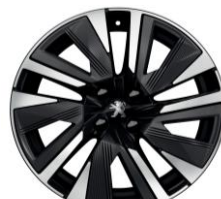
18" zliatinové disky BUND