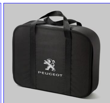
Taška na nabíjacie káble Peugeot 98 379 450 80