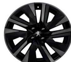
18" zliatinové disky EVISSA