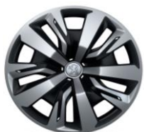
16" kryty kolies NOLITA