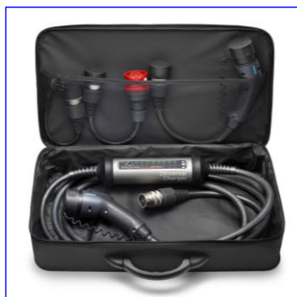
Súprava s nabíjacou jednotkou pre zapojenie do viacerých druhov elektrickej siete (230V/400V/WallBox) 98 357 837 80