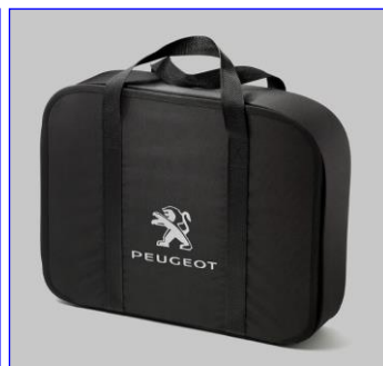
Taška na nabíjacie káble Peugeot 98 379 450 80