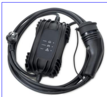
Štandardný kábel pre zapojenie do domácej 230V zásuvky 98 444 688 80