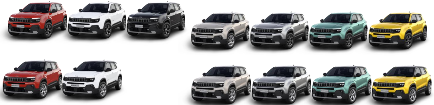
Obrázky sú ilustračné