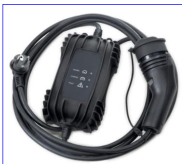
Štandardný kábel pre zapojenie do domácej 230V zásuvky