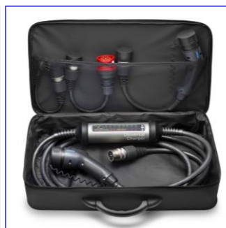
Súprava s nabíjacou jednotkou pre zapojenie do viacerých druhov elektrickej siete (230V/400V/WallBox)