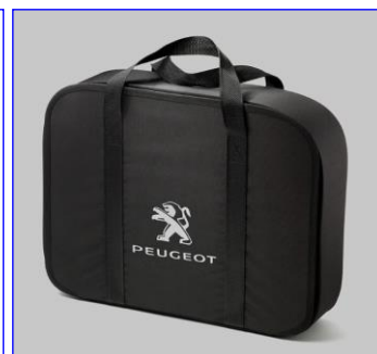
Taška na nabíjacie káble