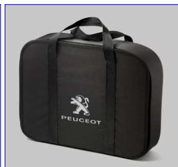
Taška na nabíjacie káble Peugeot 98 493 006 80