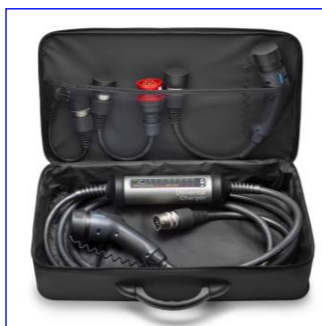
Súprava s nabíjacou jednotkou pre zapojenie do viacerých druhov elektrickej siete (230V/400V/WallBox) 98 460 313 80