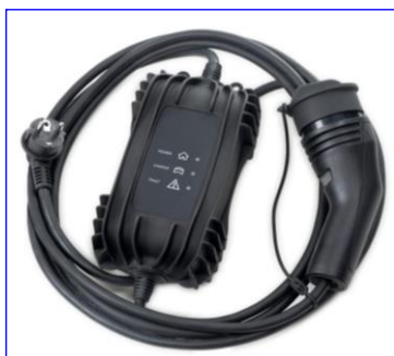
Štandardný kábel pre zapojenie do domácej 230V zásuvky 98 467 444 80