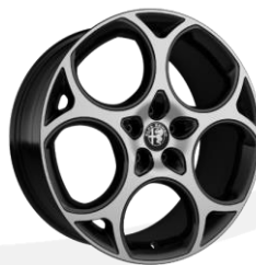
19" disky z ľahkých zliatin (pneu 235/45 R19)