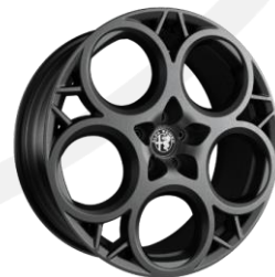
20" disky z ľahkých zliatin (pneu 235/40 R20)