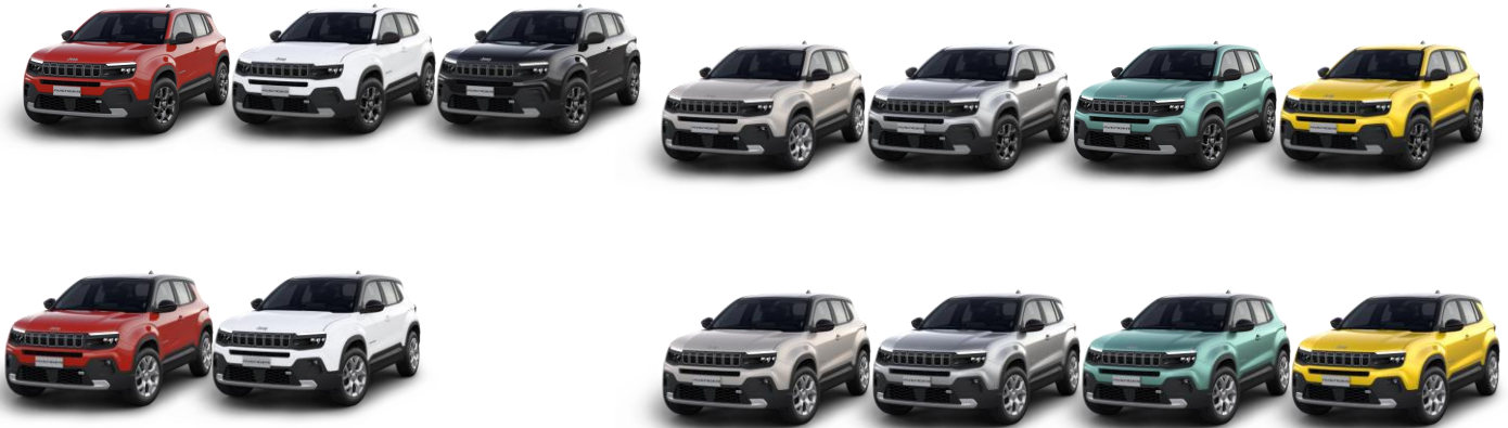
Obrázky sú ilustračné

Žltá lakovaná pristrojová doska a čalúnenie sedadiel látka/vinyl so žltým vzorom