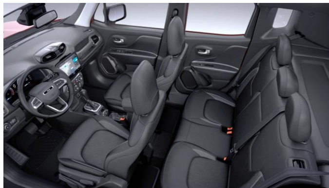
Obrázky sú ilustračné