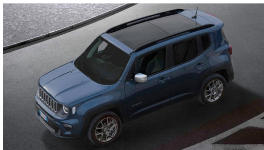
Dvojdielne strešné okno