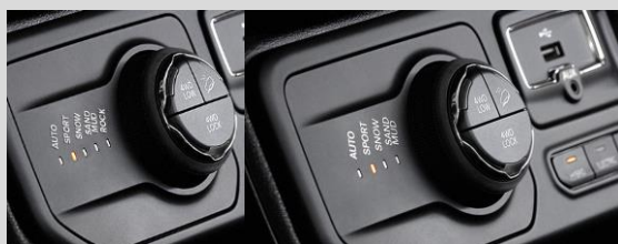
Obrázky sú ilustračné