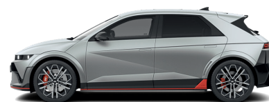
Gravity Gold – Matná 1 090 €