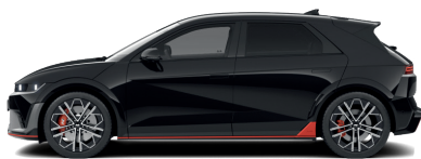
Abyss Black – Perleťová 760 €