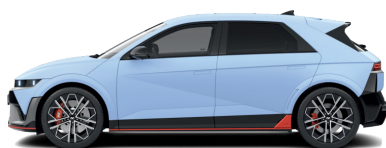
Performance Blue – Matná 1 090 €