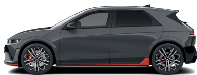
Ecotronic Gray – Perleťová 760 €