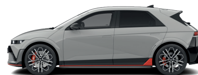
Cyber Gray – Metalická 760 €