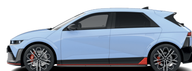
Performance Blue – Pastelová 760 €