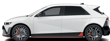
Atlas White – Pastelová 760 €