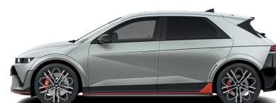
Gravity Gold – Matná 1 090 €