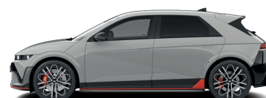
Cyber Gray – Metalická 760 €