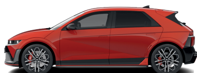
Soultronic Orange – Perleťová 0 €