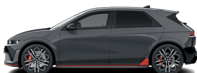
Ecotronic Gray – Perleťová 760 €