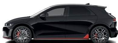
Abyss Black – Perleťová 760 €