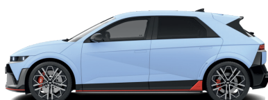
Performance Blue – Matná 1 090 €