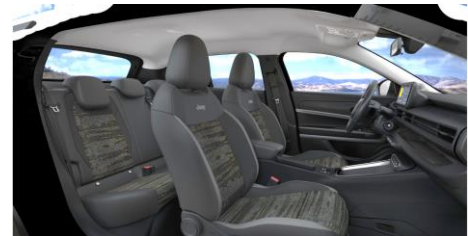
Obrázky sú ilustračné