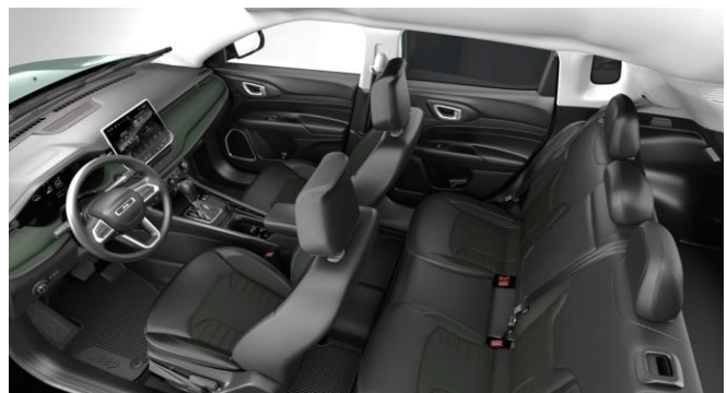
Obrázky sú ilustračné