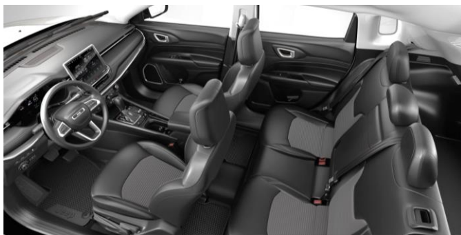
Obrázky sú ilustračné