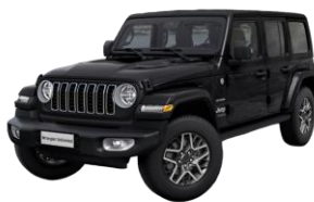
čierna 1 200 €