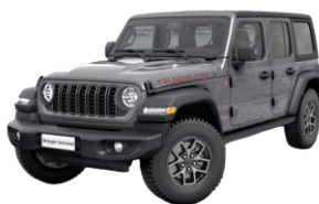
čierna 1 150 €