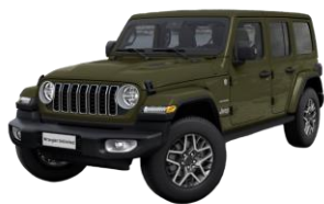
zelená Sarge 0 €