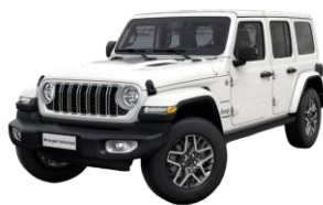
biela Bright 1 200 €