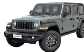
sivá Earl 1 150 €