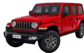
červená Firecracker 1 200 €