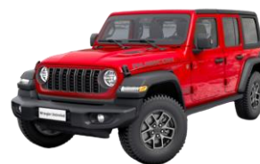
červená Firecracker 1 150 €