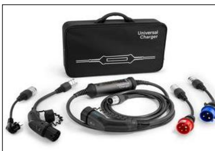
Súprava s nabíjacou jednotkou pre zapojenie do viacerých druhov elektrickej siete (230V/400V/WallBox) 98 460 314 80