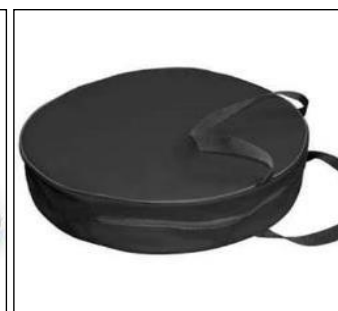
Taška na nabíjacie káble 98 412 134 80