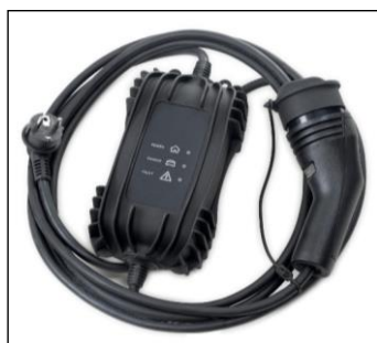
Štandardný kábel pre zapojenie do domácej 230V zásuvky 98 505 251 80