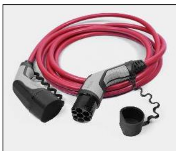
Kábel režimu 3 pre pripojenie do nabíjacej stanice (domáceho WallBoxu alebo verejnej stanice)