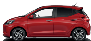
Dragon Red - Perleťová* 590 €