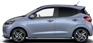
Meta Blue - Perleťová* 590 €