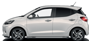
Lumen Gray - Perleťová* 590 €