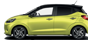
Lucid Lime - Metalická* 590 €