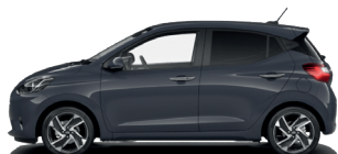
Aurora Gray - Perleťová 590 €