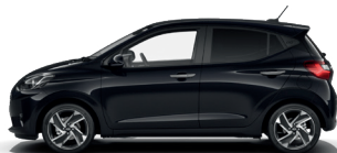
Phantom Black - Perleťová 590 €