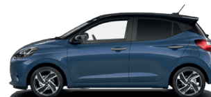
Vibrant Blue - Perleťová* 590 €