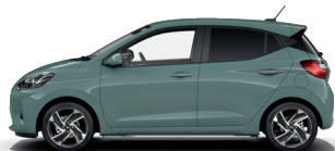
Mangrove Green - Perleťová* 0 €

* Dostupné v kombinácii so strechou lakovanou v čiernej farbe.