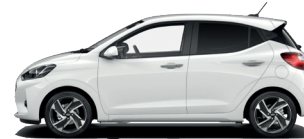
Atlas White - Pastelová* 590 €