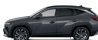
Ecotronic Gray – Perleťová 3 760 €