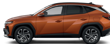
Jupiter Orange – Metalická 3 760 €