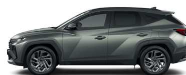
Pine Green – Matná 3,4 1 090 €