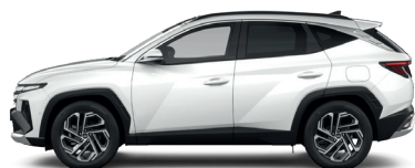
Serenity White – Perleťová 3 760 €