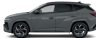
Shadow Gray – Pastelová 3 300 €