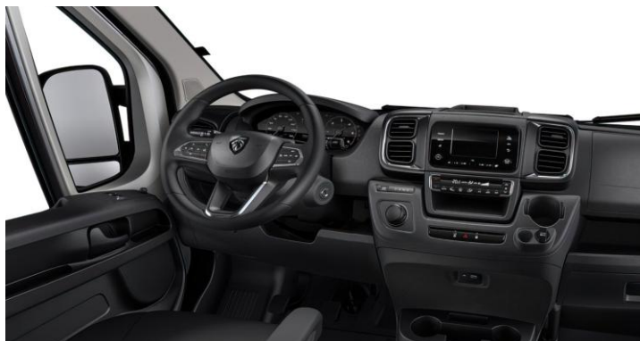
Látkové čalúnenie CREPPE BLACK MEDIUM (za príplatok)