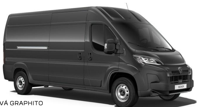
SIVÁ GRAPHITO metalická