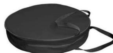
Taška na nabíjacie káble – 98 412 134 80