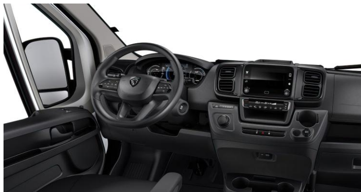
Čierne látkové čalúnenie (v sérii)