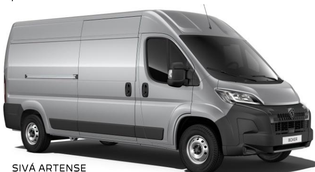
SIVÁ ARTENSE metalická