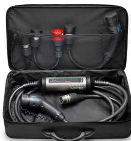
Súprava s nabíjacou jednotkou pre zapojenie do viacerých druhov elektrickej siete (230V/400V/WallBox) – 98 460 314 80