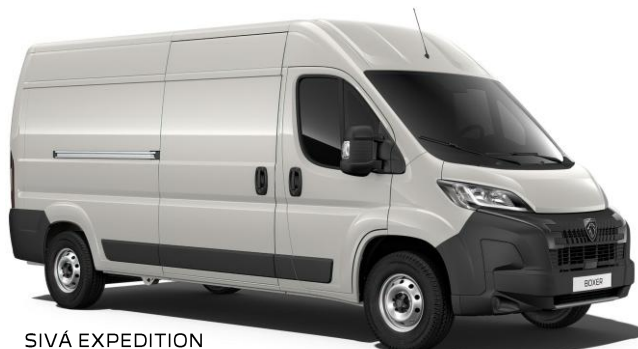
SIVÁ EXPEDITION pastelová