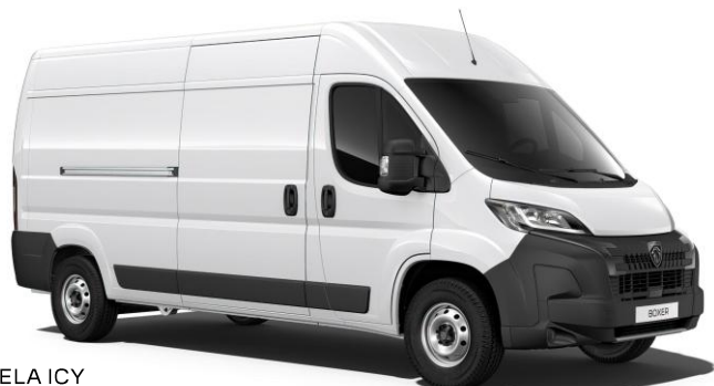
BIELA ICY pastelová