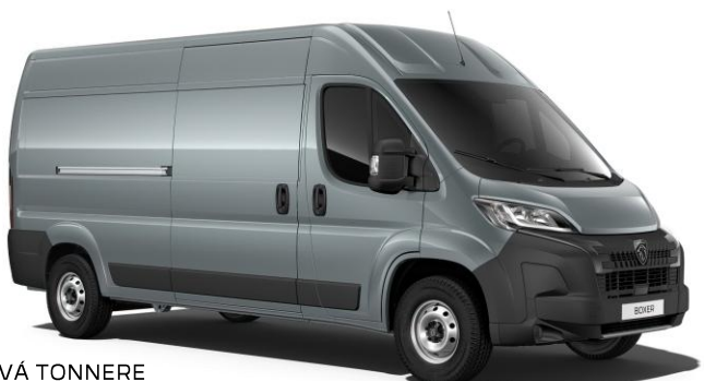
SIVÁ TONNERE pastelová