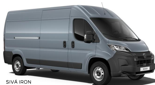
SIVÁ IRON metalická