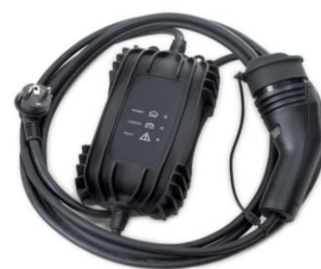
Štandardný kábel pre zapojenie do domácej 230V zásuvky – 98 505 251 80