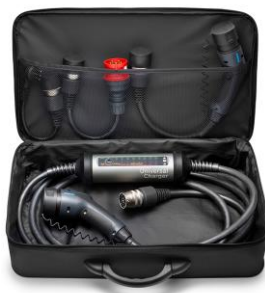
Súprava s nabíjacou jednotkou pre zapojenie do viacerých druhov elektrickej siete (230V/400V/WallBox) – 98 460 314 80