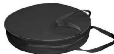
Taška na nabíjacie káble Peugeot – 98 493 006 80