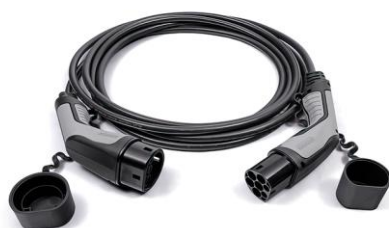
Kábel režimu 3 pre pripojenie do nabíjacej stanice (domáceho WallBoxu alebo verejnej stanice)