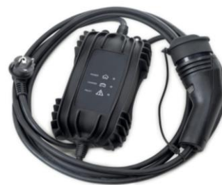
Štandardný kábel pre zapojenie do domácej 230V zásuvky – 98 505 251 80