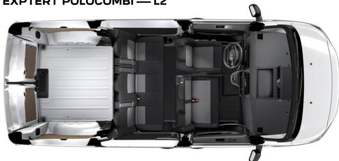
EXPERT POLOCOMBI — L2