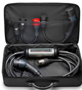
Súprava s nabíjacou jednotkou pre zapojenie do viacerých druhov elektrickej siete (230V/400V/WallBox) – 98 460 314 80