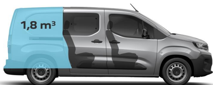
S dvomi radmi sedadiel objem nákladového priestoru 1,8 m 3