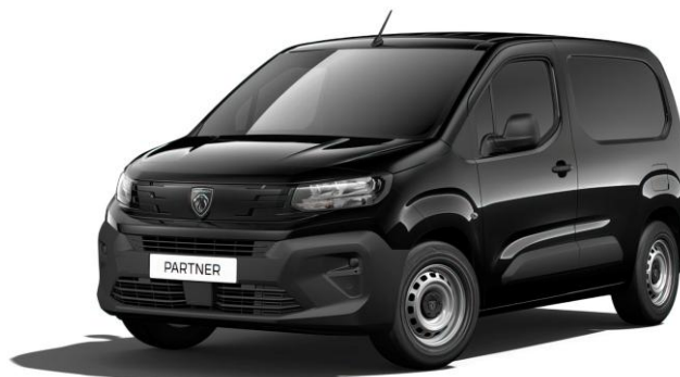
ČIERNÁ PERLA NERA