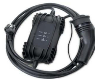
Štandardný kábel pre zapojenie do domácej 230V zásuvky – 98 505 251 80