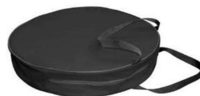
Taška na nabíjacie káble Peugeot – 98 493 006 80