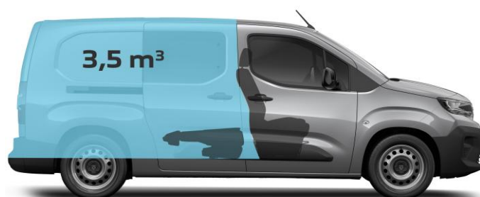
Druhý rad sedadiel sklopený / zasunutý objem nákladového priestoru 3,5 m 3