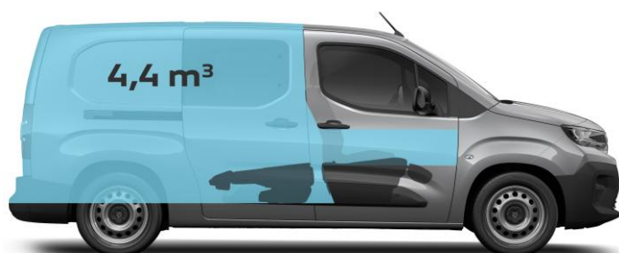
Sklopený druhý rad sedadiel a sedadlo spolujazdca, priečka otvorená, objem nákladového priestoru 4,4 m 3