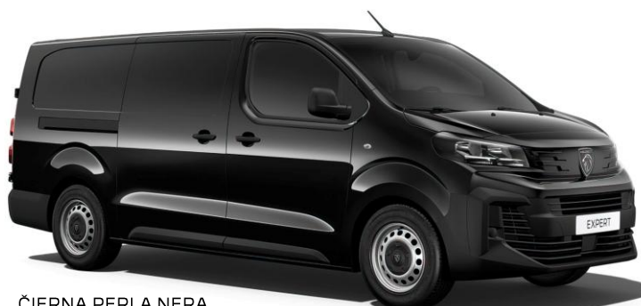
ČIERNÁ PERLA NERA